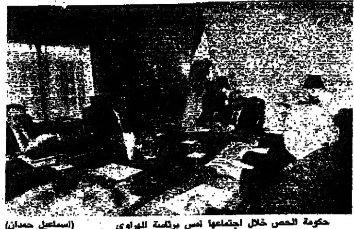
حكومة الحصص خلال اجتماعها أمس برئاسة اللواء (استعمل حمدان)

غلب أي معنى ملموس يشكل مؤشراً حاسماً يصب في خلة إعطاء دفع للمفاوضات القائمة، يبقى حركة الاتصالات والمشاورات على توسيع دائرتها، والخضوع، لا تخرج من دائرة البحث عن الحل وسط العمل المتوافق مع رغبة الأطراف في المنطقة الشرقية بإنهاء حل الحرب وتوجيهها بإتفاق سياسي شامل على مستوى المنطقة. على مستوى الوطن ككل. وفيما تواصل اللجنة الشرقية للحوار وسطه وسطه وامن شامل على مختلف المحاور المستوحى في المناطق الشرقية، باستثناء لتكتف محبوبة على محورين اللبنيون الصلوبي، علاقتها اللجنة الأمنية المشتركة بين الجيش، والقوات اللبنانية، تلعب عضواً لجنة الوساطة الإقليمي بولس نعمان واللحمي شكر أبو سليمان اتصالاً، فزار أمس الرئيس سليمان فرنجية في زيارته وبحثا معه الأوضاع العامة وخصوصاً في شرق العاصمة، ووضعها في أجواء مهمتها في ضوء اتفاق الهدنة الستة المعلن بين الجيش، والقوات. وأشار الحملي أبو سليمان بعد اللقاء إلى أننا وضعتنا الرئيس فرنجية في الأجواء الحاصلة والسعي التي تقوم بها بهدف الحوار الحاضر، مؤكداً حصول تقدم على الصعيد الأمني، ولأننا في الآن، الأمور السياسية يجري حلها وقد تم تجاوز الصعوبات.